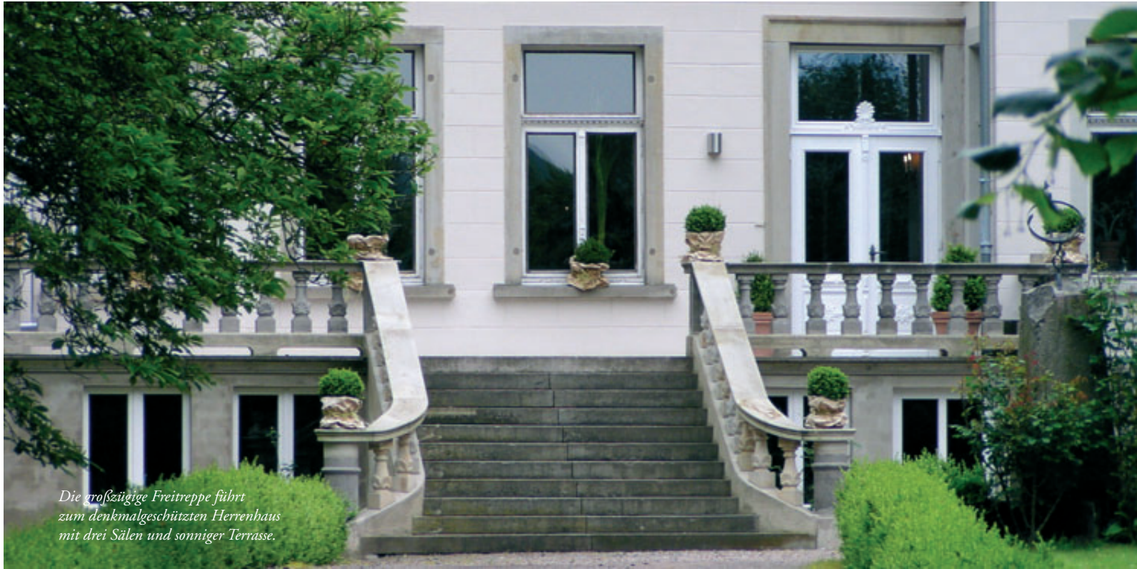
Die großzügige Freitreppe führt zum denkmalgeschützten Herrenhaus mit drei Sälen und sonniger Terrasse.